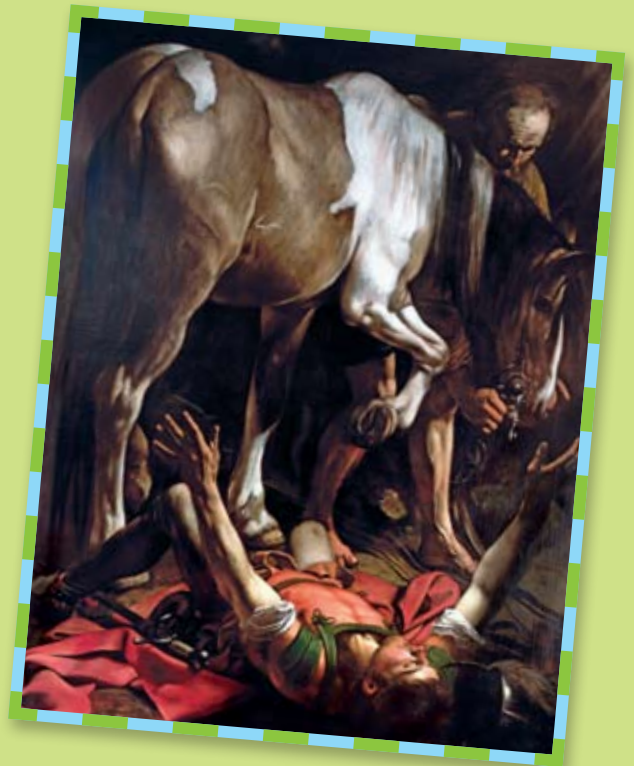
La conversión de San Pablo, c.1601 Michelangelo Merisi da Caravaggio (1571–1610 italiano)

Ven, Espíritu Santo, Danos la fortaleza de tu gracia para enfrentar con valentía los desafíos de la vida, para lograr nuestras metas aun más allá de nuestras necesidades y para trabajar fielmente en el logro de nuestra meta final de vida eterna contigo, con el Padre, y con el Hijo. Amén.