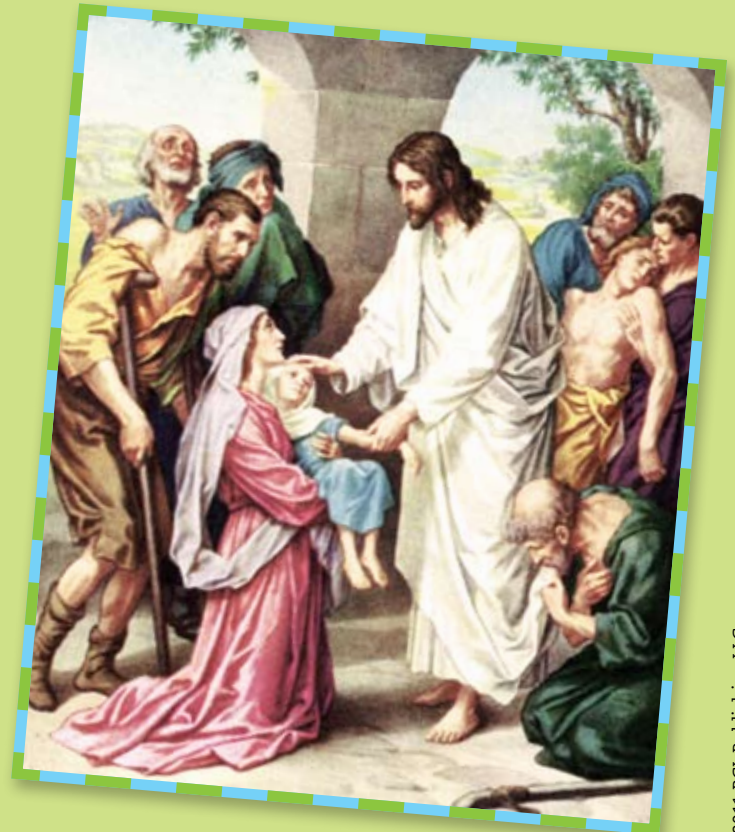
Jesús sana a los enfermos por Heinrich Hofmann (1940)

Cuando rezas puedes compartir tiempo con Jesús de la misma manera que lo haces con tu familia y tus amigos. La oración es una manera de expresar y compartir tus sentimientos con Jesús. Él está siempre listo para escuchar cómo te sientes. Jesús te ama sin importar cómo te sientas.